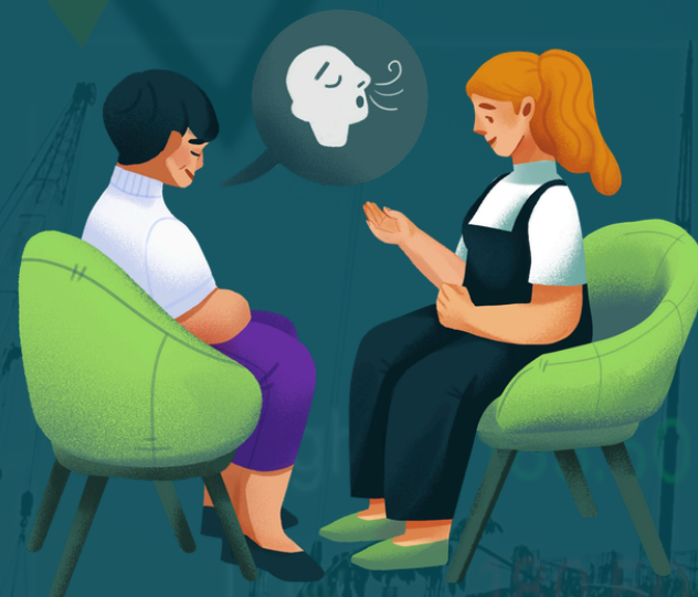
Consiliere și orientare