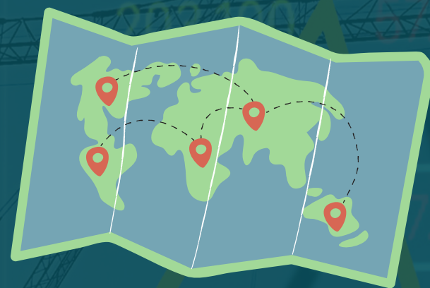
Mobilități ERASMUS +