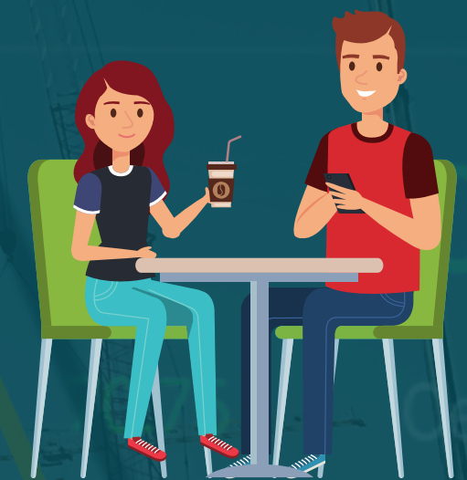
Cantină și cafenea